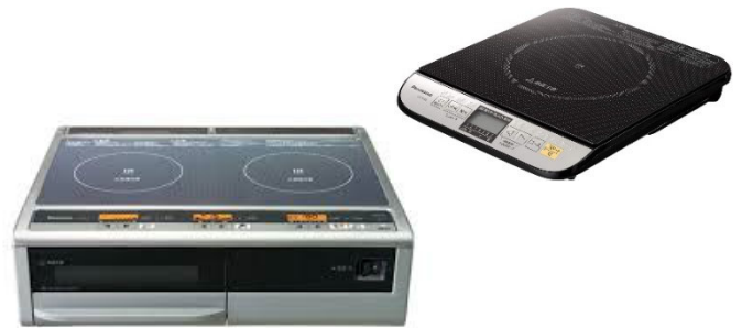
【IH クッキングヒーター】